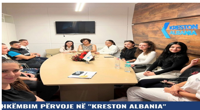
HKËMBIM PËRVOJE NË “KRESTON ALBANIA”